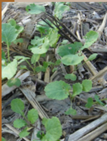
Detall de la naixença de la colza farratgera darrera blat de moro

Per l'objectiu del cultiu captador, no s'ha de fertilitzar ni aplicar herbicida per controlar les males herbes. Les lleguminoses no són bons cultius captadors de nitrogen del sòl. Cal gestionar el cultiu amb la mínima despesa econòmica. Cal aixecar el cultiu captador amb temps suficient per fer les feines de preparació del terreny del cultiu principal.