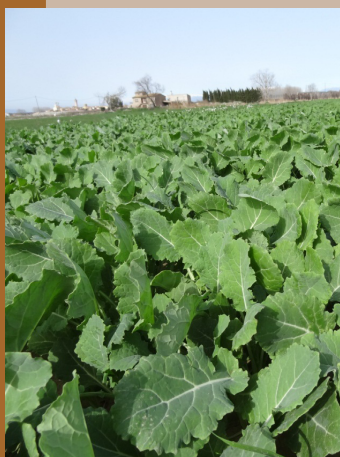
Detall del cultiu de colza farratgera

L'alliberament de nitrogen després d'adobar amb dejeccions ramaderes en el cultiu de regadiu del blat de moro segueix la tendència al llarg de l'any assenyalada de color blau, mentre que el consum de nitrogen del blat de moro segueix la pauta de la línia verda. Si a continuació no es sembla un cultiu captador, el nitrogen que es continua mineralitzat de les dejeccions ramaderes, juntament amb la pluja abundant dels mesos de tardor i hivern provoca un rentat d'aquest nitrogen que pot anar a parar a les aigües freàtiques i/o torrents i rieres de la zona.